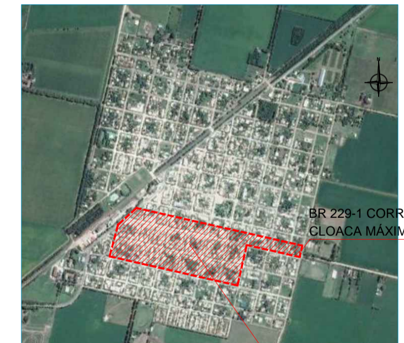
Localidad Las Perdices 32° 40' 06" S 63° 42' 17" O